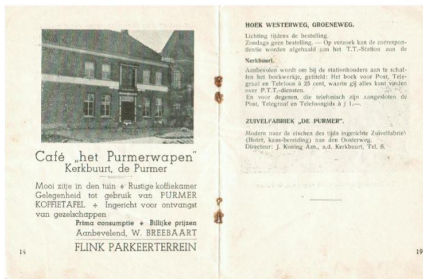
Foto uit het boekje bij viering van 325 jaar de Purmer.

Voor wie van ver komt is er de mogelijkheid om, tegen een aantrekkelijke korting, een kamer te boeken bij Van der Valk Hotel Volendam. Dit hotel is ook één van de sponsoren van Purmer 400 jaar. In de volgende nieuwsbrief volgt de informatie over het aanmelden, de kosten en alle details over de middag en hoe de overnachting met korting geboekt kan worden.